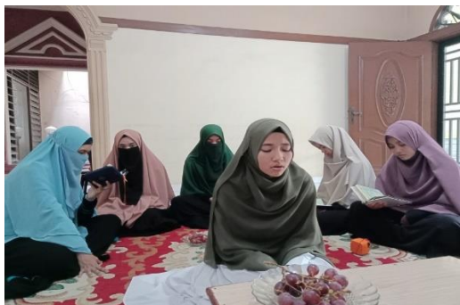
Gambar 4.6 Tes Hafalan Mingguan