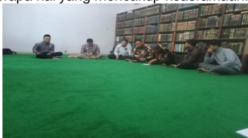
Gambar 4.7 Rapat Evaluasi Bulanan

Berdasarkan keikutsertaan peneliti dalam keggiatan evaluasi bulanan tahfidhz di Ma'had Abu Ubaidah bin Al-Jarrah agenda yang dibahas dalam rapat adalah hal-hal yang berkembang dan tidak berkembang termasuk hasil hafalan santri dalam sebulan, target hafalan yang tercapai dan tidak tercapai, santri dengan hafalan dan akhlak yang baik, santri yang belum mencapai target, program yang dijalankan dan program yang tidak dijalankan, kedisiplinan, kebersihan dan beberapa hal yang mencakup keasramaan.