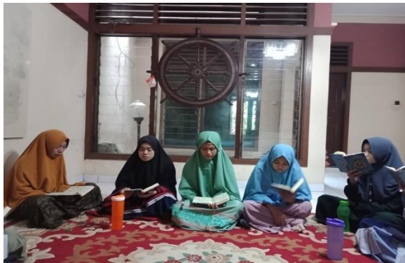
Gambar 4.5 Kegiatan Tasmi'

Peneliti juga mewawancarai beberapa ustadzah untuk mendapatkan data terkait pelaksanaan muroja'ah sabqi di rumah tahfidz Ma'had, salah satunya ustadzah Anita Rahmi, berikut pemaparan yang diberikan ustadzah Anita Rahmi dari hasil wawancara: