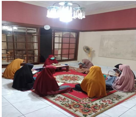
Gambar 3.1 Berdoa sebelum halaqoh dimulai

mendengarkan hafalan muroja'ah sabqinya kepada teman sebelum ditasmi'kan kepada ustadzah.