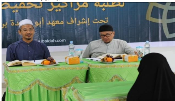
Gambar 4.8 Tes Hafalan Akhir Tahun

evaluasi tahunan ini yang akhirnya akan disertakan dalam bentuk nilai sebagai tanda santri telah menyelesaikan program pendidikan setahun di rumah tahfidz Ma'had Abu Ubaidah bin Al-Jarrah.