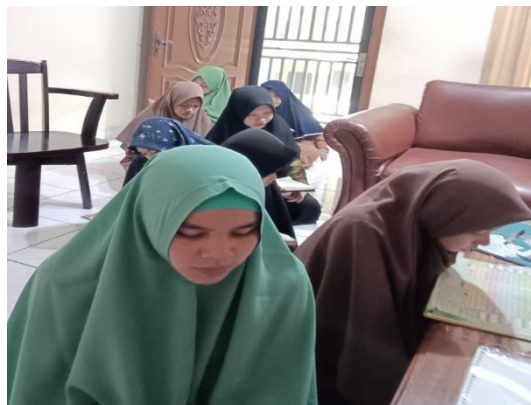
Gambar 3.2 Antrian Tasmi' Muroja'ah Sabqi

Maksudnya agar setiap santri menyiapkan dengan baik muroja'ahnya dan bertanggung jawab. Hal ini juga sesuai dengan pemaparan dari ustadzah Rizky dan Fitri yaitu setiap santri harus memiliki antrian untuk tau kapan dia harus maju dan muroja'ah sabqi jika tidak demikian santri akan menunda-nunda waktu dan saling menolak untuk mentasmi'kan muroja'ah sabqi kepada musyrif/ah nya.